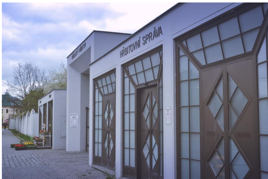
Obr. 6 Hlavní brána Ďáblického hřbitova spolu se zázemím a obchodem

Ďáblický hřbitov je svým pojetím zcela ojedinělým a výjimečným příkladem ztvárnění, ale i chápání hřbitova na území města Prahy.