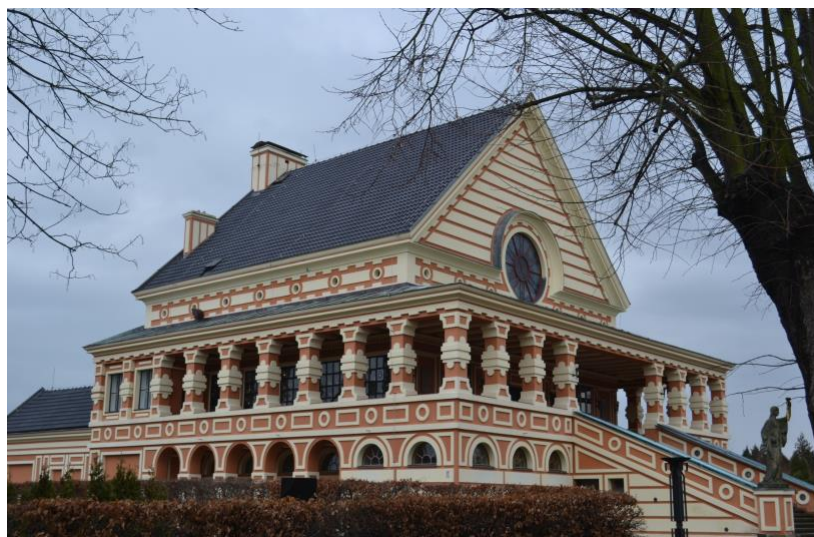
Obr. 4 Pardubické krematorium s ochozem, kde je situováno kolumbárium a hlavním vstupem s 22 schody