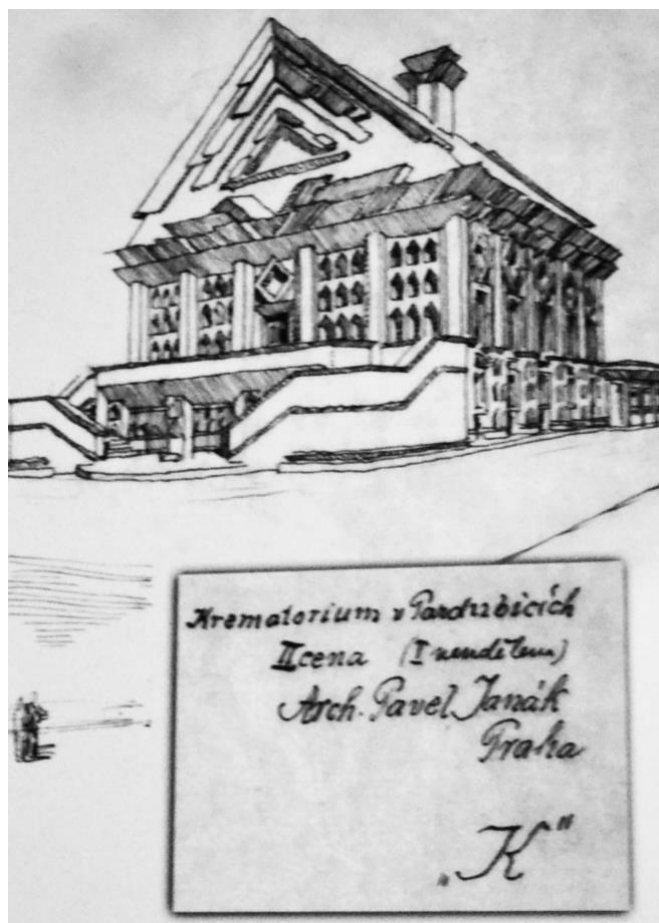
Obr. 3 Soutěžní návrh Pavla Janáka, 2. cena