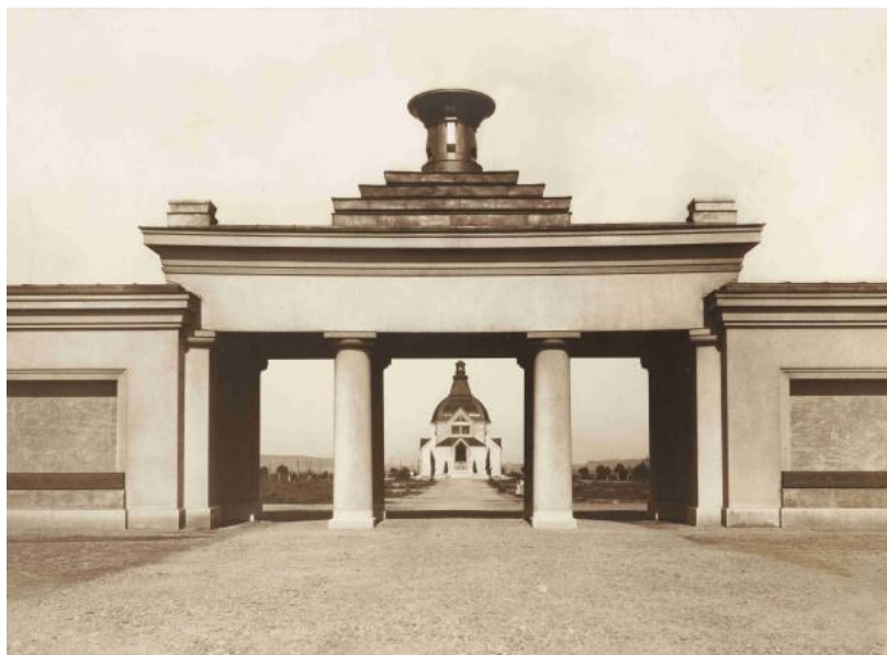
Obr. 1 Monumentální brána u Gottwaldovy třídy s průhledem na ostravské krematorium (zdroj: https://www.gvuo.cz/aktuality/ostrava-za-prvni-republiky-aneb-predstav-si-milacku-ze-uz-zprovoznili-to-nove-krematorium_nd37 , staženo 2. 4. 2020)