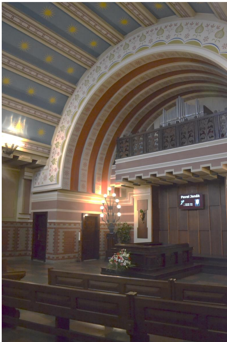
Obr. 5 Temný interiér pardubického krematoria s „vítězným obloukem“ a vyvýšeným katafalkem

Hřbitovy byly realizovány od dob Josefínských reforem mimo sídla, jako přísně ohraničené areály [15]. Středem většinou vedla hlavní cesta, která gradovala ke kříži, symbolu křesťanství a naděje a na ní kolmo navazovaly v pravidelném rastru husté linie bočních cest obložené hroby. Když byl však v letech 1912-14 zakládán nový Ďáblický hřbitov, byl koncipován volněji. Současná koncepce vznikala postupně, nejdříve ve 20. letech, příjezdové komunikace v roce 1949 a další uspořádání pak vycházelo z anonymní soutěže na urbanistické řešení obřadní síně a hřbitova (od počátku se uvažovalo o výstavbě krematoria s obřadní síní, tato možnost byla znovu prověřována v 60. letech, ovšem nikdy k realizaci nedošlo) [17]. Jeho cesty a tvary jednotlivých hřbitovních sektorů byly navrženy zcela organicky.