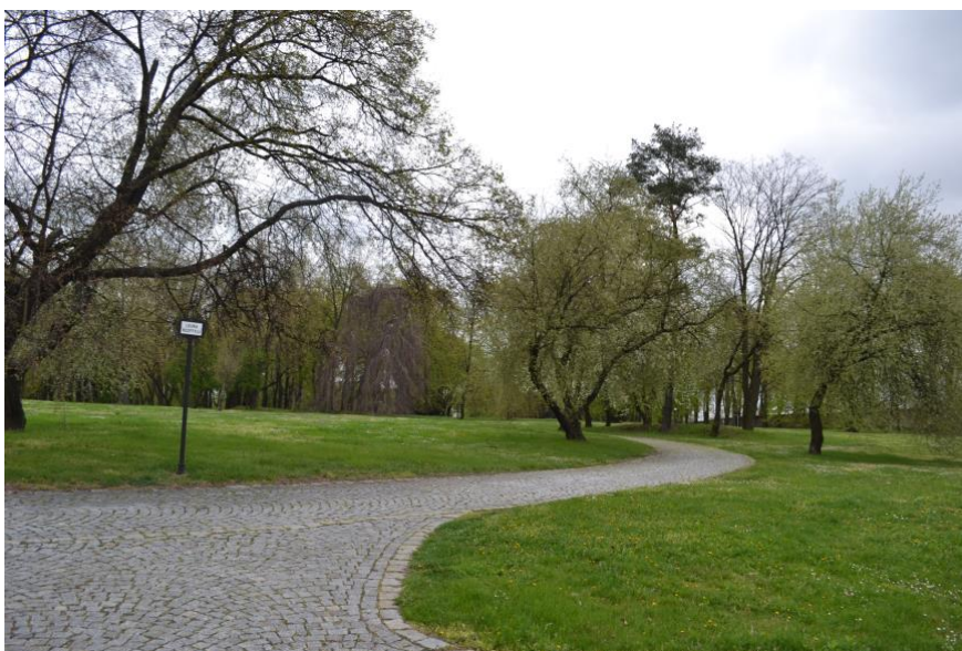
Obr. 7 Organicky se ubíhající pěšiny Ďáblického hřbitova